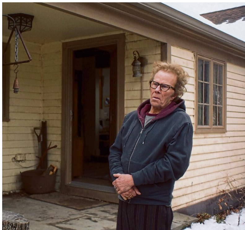
Tom Waits als zauseliger Vater

noch ein paar Scheine Geld in die Hand. Sehr steif läuft die Konversation auch in der zweiten, in Dublin spielenden Geschichte. In der sind die beiden ungleichen Schwestern Timothea und Lilith (Cate Blanchett, Vicky Krieps) einmal im Jahr bei ihrer Mutter (Charlotte Rampling) zur penibel vorbereiteten Teatime zu Gast. Doch weder die verhuschte Timothea noch die flippige Lilith,