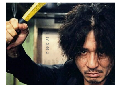
Choi Min-Sik als Dae-su Oh

Thriller – Dae-Su Oh, ein unscheinbarer Bürger, verschwindet eines Nachts von offener Straße und findet sich in einem möblierten Zimmer wieder, wo er 15 Jahre lang gefangen gehalten wird. Als er frei kommt, will er wissen, wer ihn gefangen hielt und warum. Seine Wut ist gewaltig. Eine originelle Ausgangslage für einen furios inszenierten Thriller von 2004, der Südkoreas Status als aufsteigende Filmnation zementierte. Filmautor Park Chan-wook drehte „Oldboy“ als technisch hochklassiges, innovatives Mittelstück seiner Rachetrieologie (nach „Sympathy for Mr. Vengeance“, vor „Lady Vengeance“). Die Szene, in der der Held sich in engem Korridor mit einem Hammer durch drei Dutzend Gegner pflügt, sollte man einmal im Leben gesehen haben. Di. (ues)