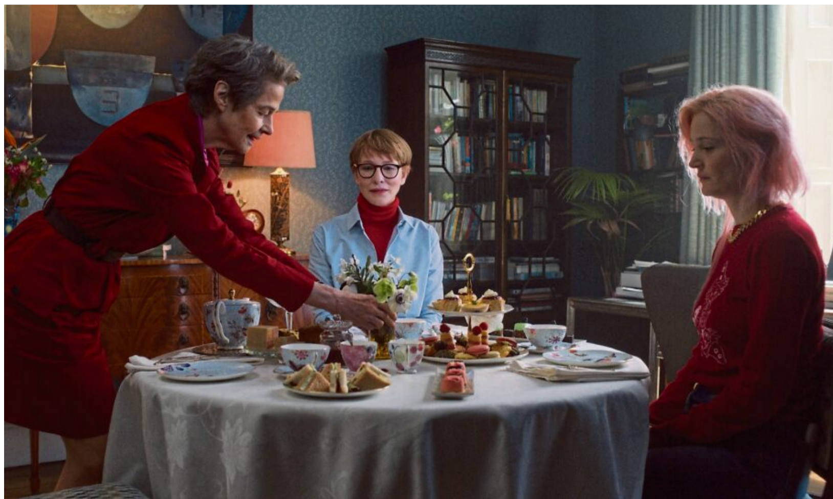
Charlotte Rampling (v.l.n.r.) als die Mutter, Cate Blanchett als Timothea und Vicky Krieps als Lilith